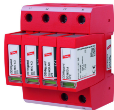
Az ábrák nem kötelező érvényűek